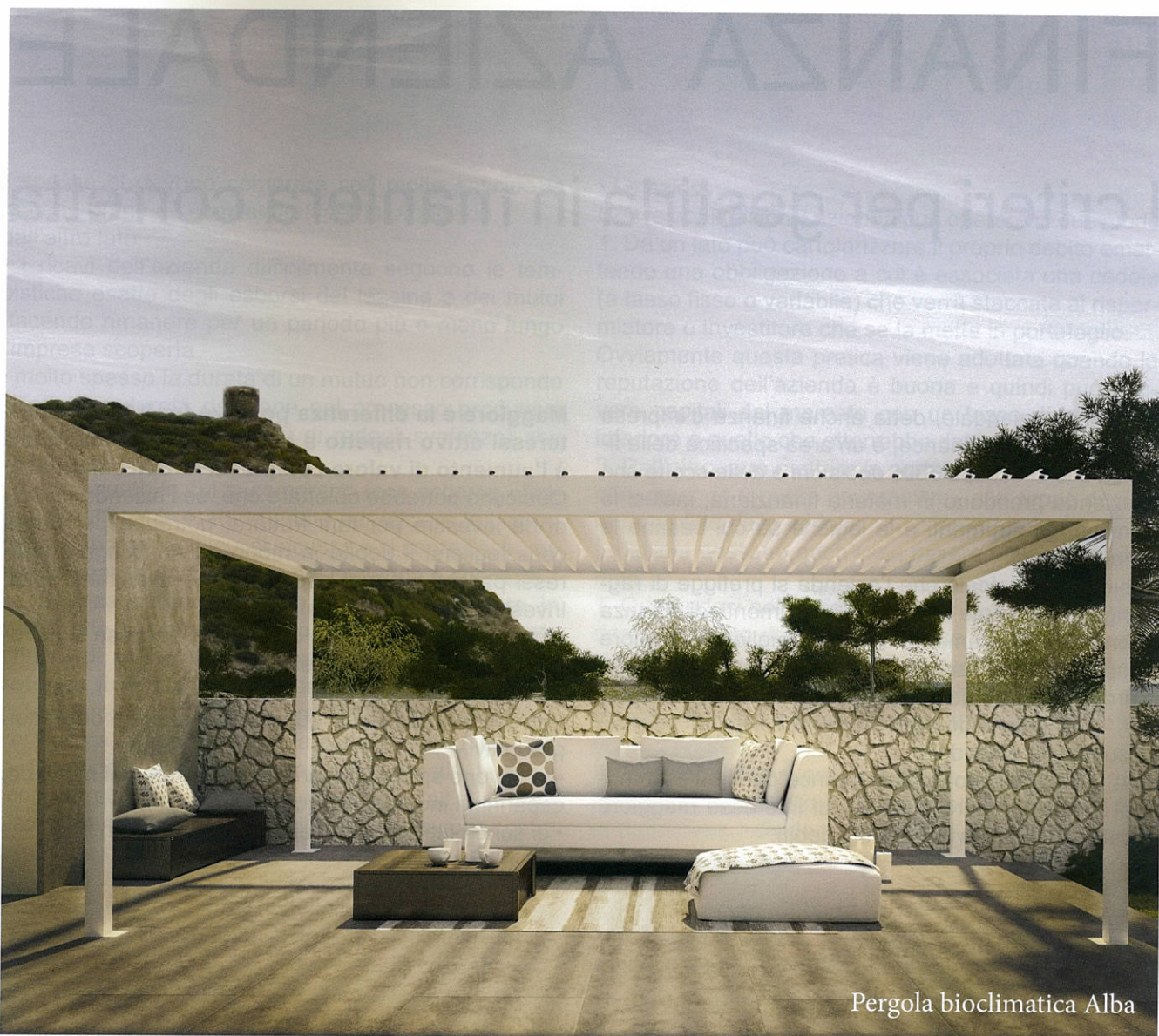
Pergola bioclimatica Alba