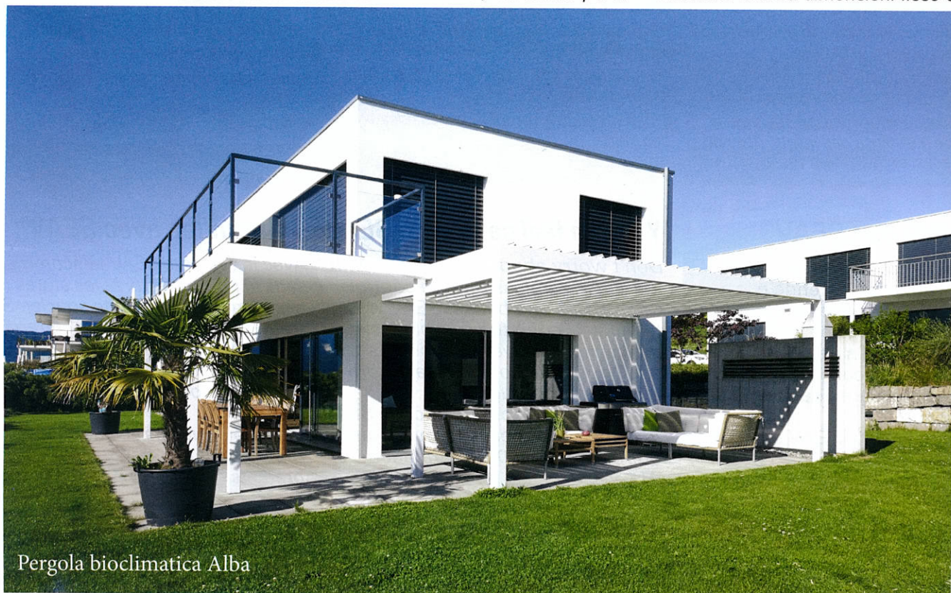
Pergola bioclimatica Alba

Come dicevo prima, di fatto Alba è stata lanciata quest'anno, così come Eteria, un'altra pergola bioclimatica che ha dimensioni fisse e