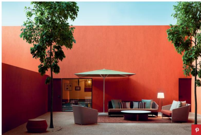
Ombrellone Meteo di Kettal

L'ombrellone rotondo Janus Teak di Janus et Cie ha il palo e la struttura in teak. La tela a strisce, disponibile in diversi colori, vanta un gusto retrò tipico degli Anni Sessanta già nominati. Così l'ombrellone personalizza di un gusto elegante e piacevolmente vintage gli ambienti all'aperto. I tessuti Janus et Cie sono disponibili in forma quadrata o rotonda, con telaio in teak o alluminio e base in granito o acciaio. In particolare, questo modello dalla forma tonda ha il palo centrale, in modo che l'ombra ruoti tutt'intorno all'oggetto a seconda delle ore del giorno.