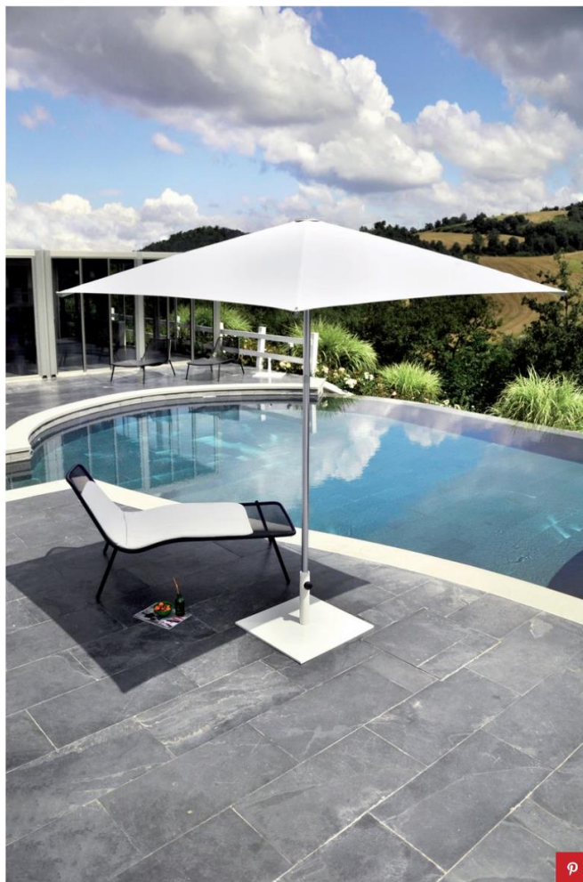
Ombrellone Shade di EMU Courtesy EMU

Il Mogambo è un parasole fine e dall'estetica retrò ed elegante - un design che contraddistingue tutti i prodotti firmati Paola Lenti . La struttura è un gioco di intrecci fatti a mano con corda Samo in filato Rope (ingredienti esclusivi della designer). Il resto dell'ombrellone è composto da alluminio, acciaio inox verniciato disponibile nei colori: avorio, grafite, mora, ruggine, sottobosco, oliva o foresta. Tutti i materiali sono pensati per stare all'aperto, quindi alluminio e acciaio sono trattati con un processo che ne eviti la corrosione. Mogambo non è richiudibile, ma può essere comodamente appoggiato a terra - in free standing o ancorato fisso.