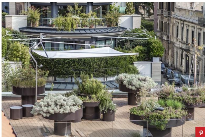
Vela Ombreggiante Defense di Corradi

Il Sun Sail Defense di Corradi è una struttura ombreggiante di derivazione nautica, realizzata in acciaio inox e dotata di vela orientabile. Due vele si avvolgono su un profilo orizzontale, sostenuto da un palo sagomato e dalla finitura satinata. Per la sua estetica fuori dal comune, Defense è stato menzionato tra i 100 oggetti di design più rappresentativi del Made in Italy. Si riavvolge in pochi secondi con radiocomando o manualmente. Se motorizzata, la vela può chiudersi automaticamente in caso di vento forte. Il telo è realizzato in Dacron, un poliestere intrecciato di derivazione nautica (sottoposto a trattamento di protezione dai raggi UV).